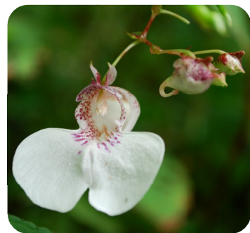
エンシュウツリフネソウ

昨年度の大幅値上げで、2008年度の国保加入世帯（2万2845世帯）に占める滞納世帯は5650世帯24.7%にもものぼります。